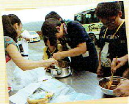
GCくまもとと交流・バブアチョコ作り