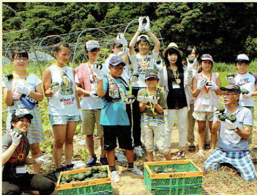
GC産直生産者の畑で農業体験