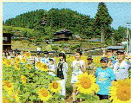
北里柴三郎記念館前のひまわりの前で