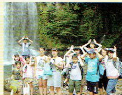
熊本県小国町で滝遊び